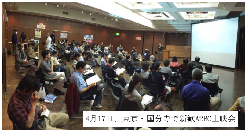
4月17日、東京・国分寺で新歓A2BC上映会