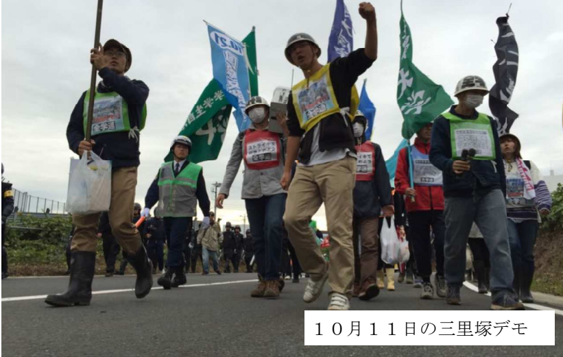
10月11日の三里塚デモ