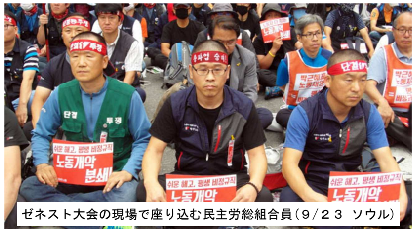
ゼネスト大会の現場で座り込む民主労総組合員(9/23 ソウル)

韓国・民主労総の闘いと連帯し、三里塚闘争の勝利と動労千葉-動労総連合のストライキ、全学連の反戦ストライキで朝鮮侵略戦争を阻止しよう！ 4名の仲間を取り戻し、10・21国際反戦デー闘争-11・1労働者総決起集会へ！