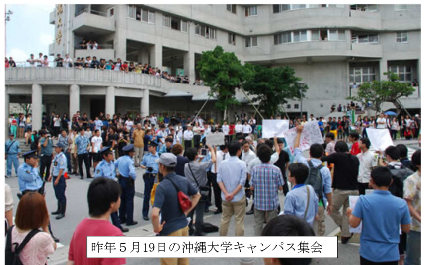
昨年5月19日の沖縄大学キャンパス集会

さらにこれは、韓国で4月24日「パク・クネ政権打倒」を掲げてゼネラルストライキにたちあがる労働組合の全国組織・民主労総の闘いとかたく連帯するものです。韓国でパク・クネ政権のもとで生きるために職場からたちあがる労働者、米軍基地建設に反対する人びと、徴兵制に怒りを燃やす学生に、日本の闘いを届けよう。安倍政権を倒し、安保・戦争国会を粉砕する壮大な闘いの出発点として、ともに4・28沖縄デー闘争にたちあがろう！