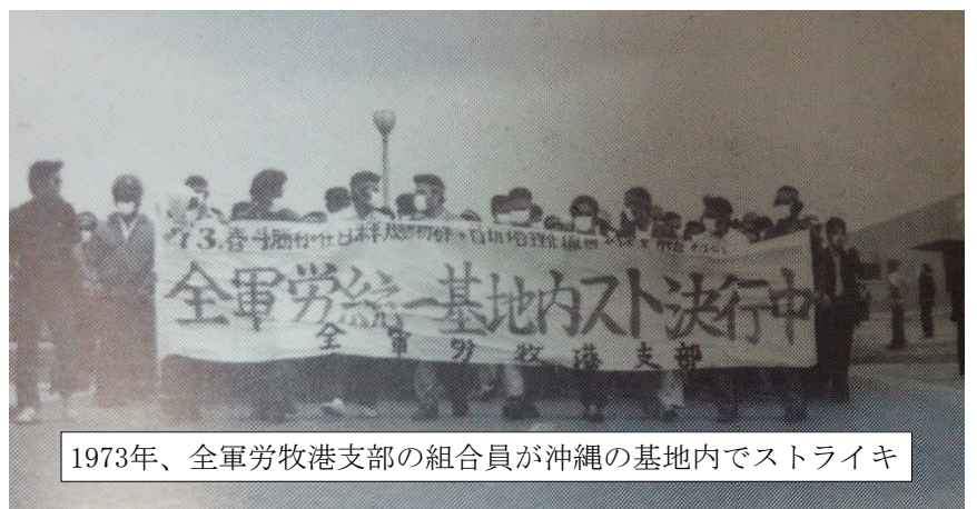
1973年、全軍労牧港支部の組合員が沖縄の基地内でストライキ

日本の労働者・学生は敗戦以来、一貫して反戦闘争をその原点としてきました。3000人ともいわれる学生を戦地に送った法政大学では、1969年の4月28日を前に、「沖縄奪還」を掲げてバリケードストライキが闘われました。またヴェトナム戦争の渦中、沖縄では基地労働者の組合である「全軍労」牧港支部が史上初となる基地内ストライキを敢行したのです。戦争をとめる力はここにこそあります！