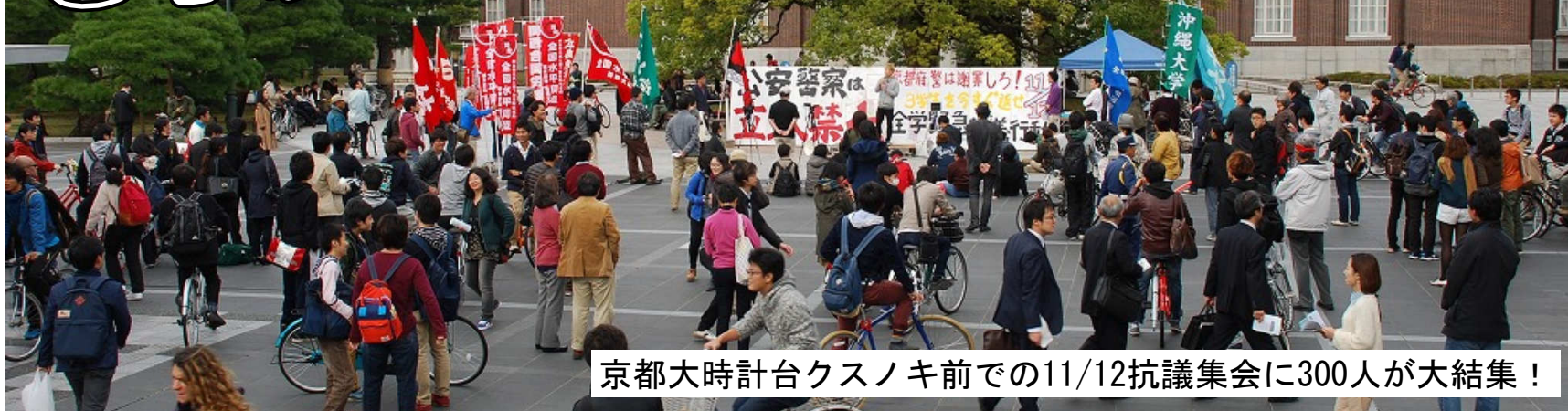
京都大時計台クスノキ前での11/12抗議集会に300人が大結集！