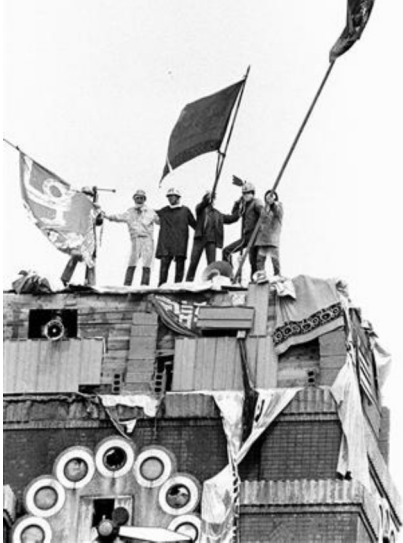
京大全共闘の大学本部時計塔 バリケード死守戦(69年9月)

ている全学自治会同学会としか会わない」と回答。しかし、肝心の同学会はまともに選挙もなされず、執行委員会の所在もわからないという有様。つまり法人化は、単に当局の強権で推進されたのではなく、自治会や教授会、職組が動かないことで進行してきたということです。