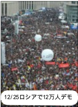
12/25ロシアで12万人デモ

世界中で闘いが沸き起こるただ中で2012年、新しい年が明けました。民衆の闘いは、アメリカやヨーロッパにとどまりません。ロシアや中国でも数十万単位の人々がデモやストライキに立ち上がっています！