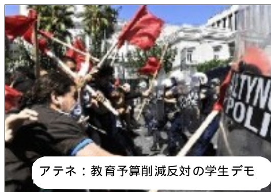
アテネ：教育予算削減反対の学生デモ

広場集合、総長室がある九段校舎に向かってデモ)を行います！2012年、法大から学生の大行動を巻き起こしていきましょう！