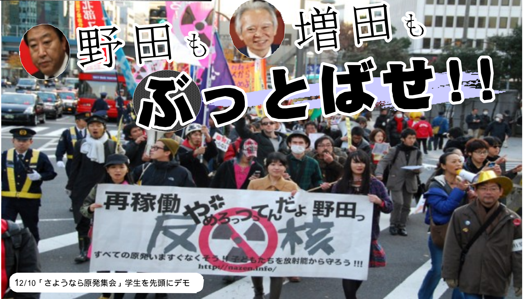
12/10「さようなら原発集会」学生を先頭にデモ