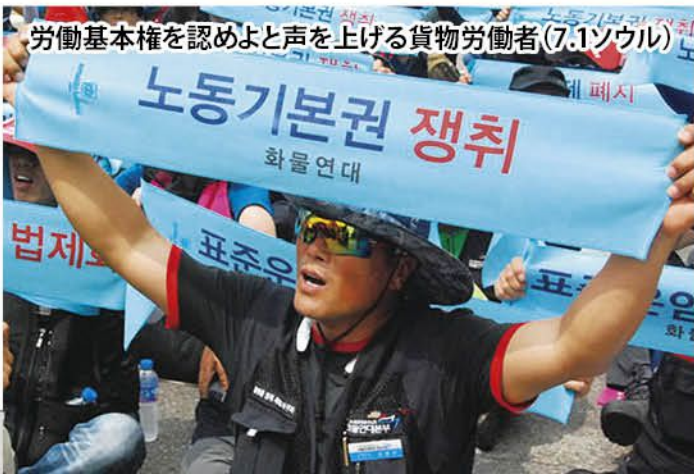
労働基本権を認めよと声を上げる貨物労働者(7.1ソウル)