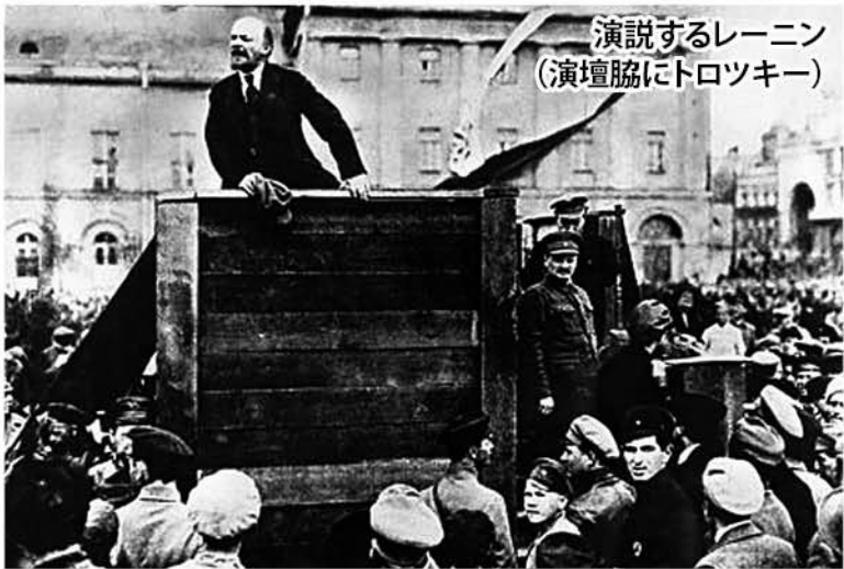
演説するレーニン (演壇脇にトロツキー)

いまこそマルクス主義をよみがえらせよう。国境をこえて団結し、闘う労働運動をよみがえらせよう。帝国主義とスターリン主義を打倒する、新しい労働者政党とともに建設しよう！