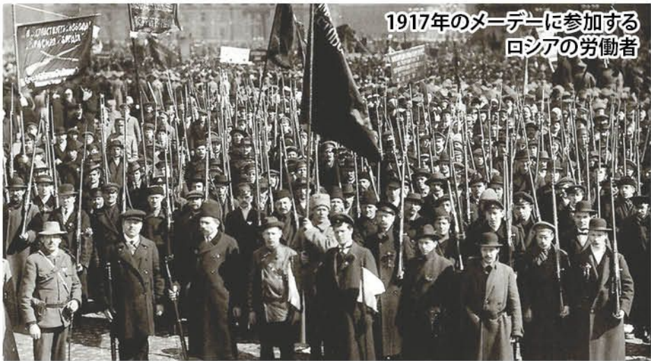
1917年のメーデーに参加する ロシアの労働者