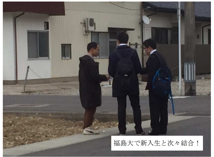
福島大で新入生と次々結合！

3日間で集まったシール投票の総数は267。反対票が賛票を上回り、キャンパスにおいて大学の軍事研究に対し根強い反対の声があることが実証されました。それ以上に重要だったのは、賛成にいった学生の意見。「研究費が大幅に削