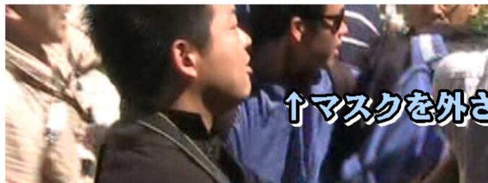
↑マスクを外された