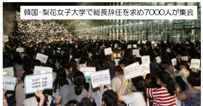
韓国・梨花女子大学で総長辞任を求め7000人が集会