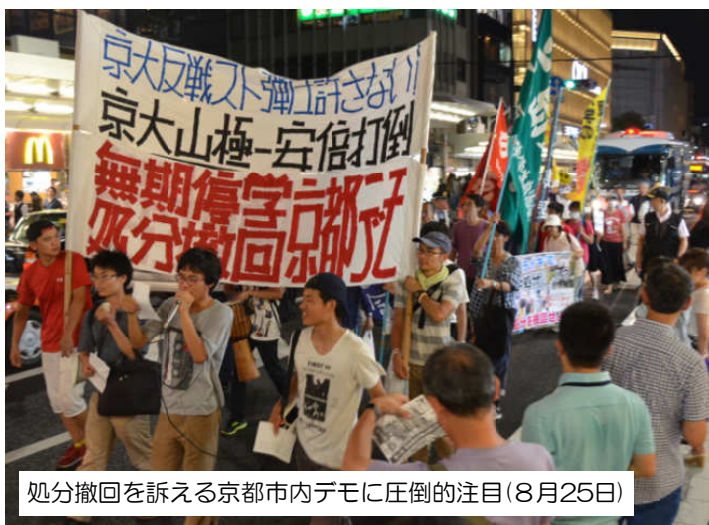
処分撤回を訴える京都市内デモに圧倒的注目(8月25日)

この大学の腐敗に対し京都大学の学生は昨年10月に反戦バリケードストライキに立ち上がりました。この先頭に立った4名の学生への「無期停学処分」こそ、安倍政権と一体で戦争に突き進む大学の姿です。本日のデモは、京大生と連帯するデモです。法大生の結集を訴えます！